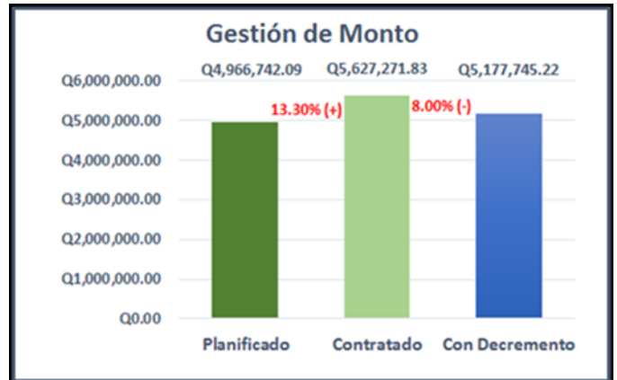
Gráfico de gestión de montos

Revisando y analizado los documentos se puede ver que el proyecto no fue bien planificado en sus renglones de trabajo ya que en el trayecto de ejecución sufrió de muchos cambios en renglones de trabajo relevantes. Al final sufre un decremento total de Q 428,433.71, correspondiente a un 8 por ciento del monto inicial, así como lo muestra el siguiente gráfico: